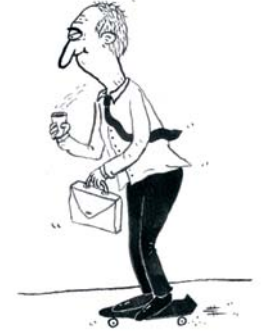
MALMO IS SO LIBERAL. IT WOULDNT SURPRISE ME IF BANKERS SKATED HERE.