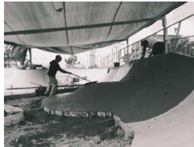
Stapelbäddsparken 2.0

Varje år ombesörjer vi dessutom Bryggeriet Skatepark och ser till att det är ombyggt, renoverat och alltid intressant och utmanande för våra medlemmar och besökare.