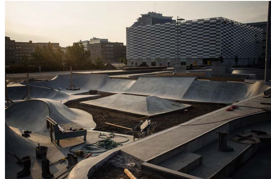
Stapelbäddsparken 2.0