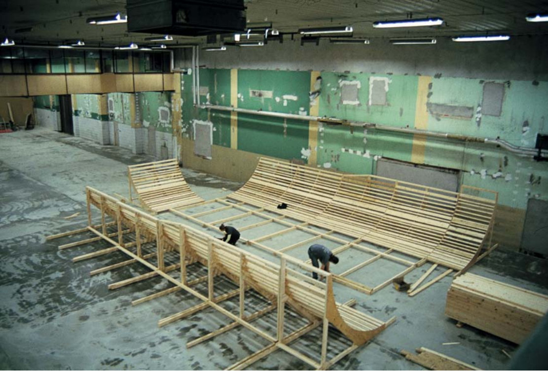
Familjen Olofsson regler upp bowlen som fortfarande står där den ska 15 år senare.

och Köpenhamn och de svettiga skate-sessionen som revs av är fortfarande legendariska.